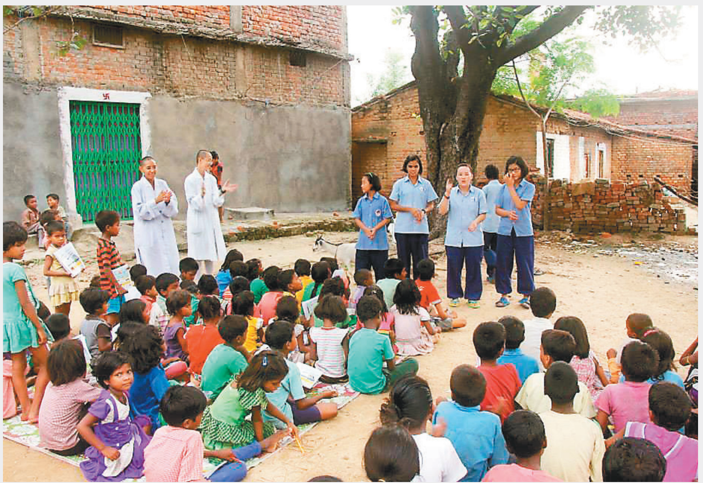
←↑「大樹下的課堂」由佛光山印度佛學院學生、法師，為鄉村學童授課、教育三好。

【人間社記者蔣蔚芬紐約報導】聯合國婦女署婦女地位委員會第66屆平行會議，3月16日進行第3天議程，聚焦「國際佛光會在印度——促進女孩和婦女的平等」，佛光會發表印度「大樹下」教育專案，分享佛光山開山星雲大師在印度弘法、倡議婦女受教權至今的成果，近千人跨越時空雲端共襄盛舉，了解佛光會透過教育賦予印度女孩和婦女權力的工作，及未來在可持續發展的目標。國際佛光會世界總會會長心保和尚致詞表示，國際佛光會在創會會長星雲大師的領導下，專注宗教對話、支持宗教和諧，這其中包括性別和種族間的平等、尊重和包容，「我們站在平等和尊重的基礎上，希望社會更加和諧」。